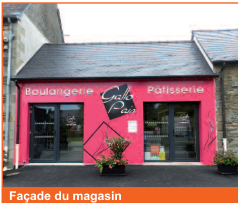
Façade du magasin